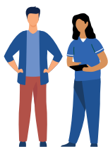
Equipe MS APA et travailleurs sociaux