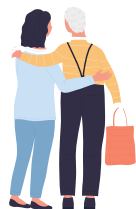
Aide à domicile

Coordination renforcée : suivi des plans d'accompagnement et de soins, coordination des interventions, surveillance gériatrique partagée, identification d'un interlocuteur unique pour le bénéficiaire et son entourage chargé de la coordination des acteurs du domicile :